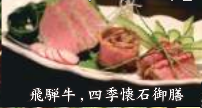
飛騨牛、四季懐石御膳