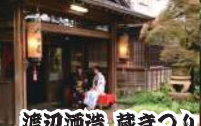
渡辺酒造 蔵まつり 楽しいイベント一杯！