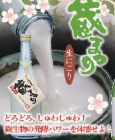
どろどろ、しゅわしゅわ！ 微生物の発酵パワーを体感せよ！